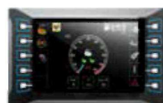
7" BAREVNÝ DISPLEJ