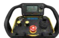
DÁLKOVÉ RÁDIOVÉ OVLÁDÁNÍ